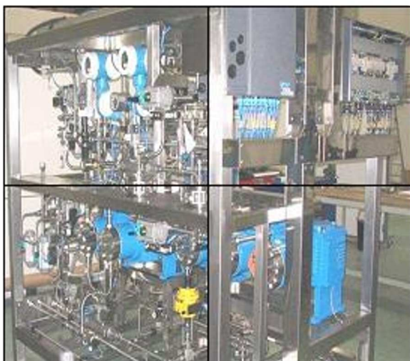
Skid de pompage en chromatographie