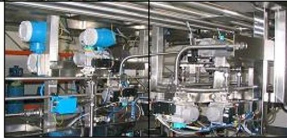
Skid de pompage en chromatographie