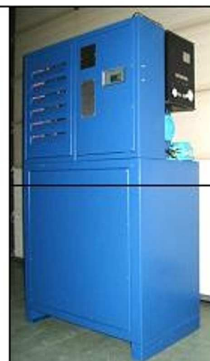
Water chiller, groupe froid ATEX